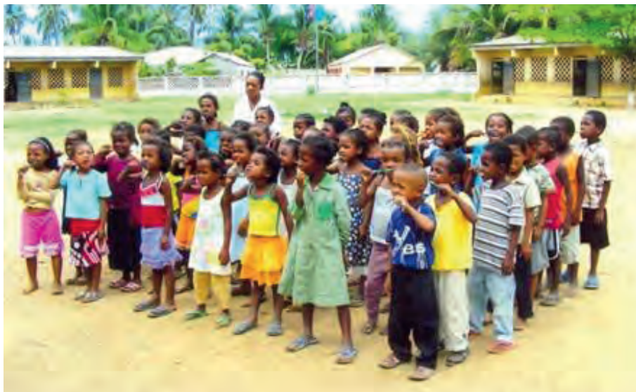
Les enfants de Soutien 400 apprennent à se laver les dents

Nous nous réjouissons de vous retrouver l'année prochaine à l'occasion de la 22 e Assemblée Générale pour vous permettre de découvrir la poursuite de nos activités.