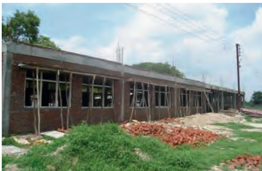
Un nouveau projet ASED a débuté en Inde

Depuis le mois de février de cette année, un nouveau projet ASED a débuté dans les environs du village de Susera (près de Gwalior), situé dans l'état du Madyha Pradesh. Dans cette région rurale défavorisée, l'accès à l'éducation de base est très limité pour les enfants. Aussi, l'ASED a-t-elle décidé d'intervenir dans la seule école de qualité qui accepte les enfants de milieux pauvres sans les faire payer : l'école Rabbani.